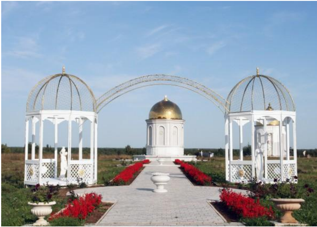
Храм Риши Васиштхи.

- Мы с учениками долго ездили по стране в поисках подходящего места и молились, чтобы нам было указано направление. И когда приехали в Ветлугу Нижегородской области, получили сразу несколько благоприятных знаков: сновидения, круглая радуга, прямая радуга. Там мы нашли три заброшенные деревни, никто в них не жил, где-то вообще остались лишь фундаменты домов. Мы остановились в одной из них. Когда было всё улажено официально, с администрацией, соорудили первый алтарный зал для собраний, медитаций. Жили в палатках, обычная для нас аскетическая жизнь. Но не все, кто поначалу был с нами, остались в этих условиях. У истоков монастыря было человек 15-20. Да ведь монастыри возникают не волей какой-то одной личности или группы людей, а исключительно по благословию свыше.