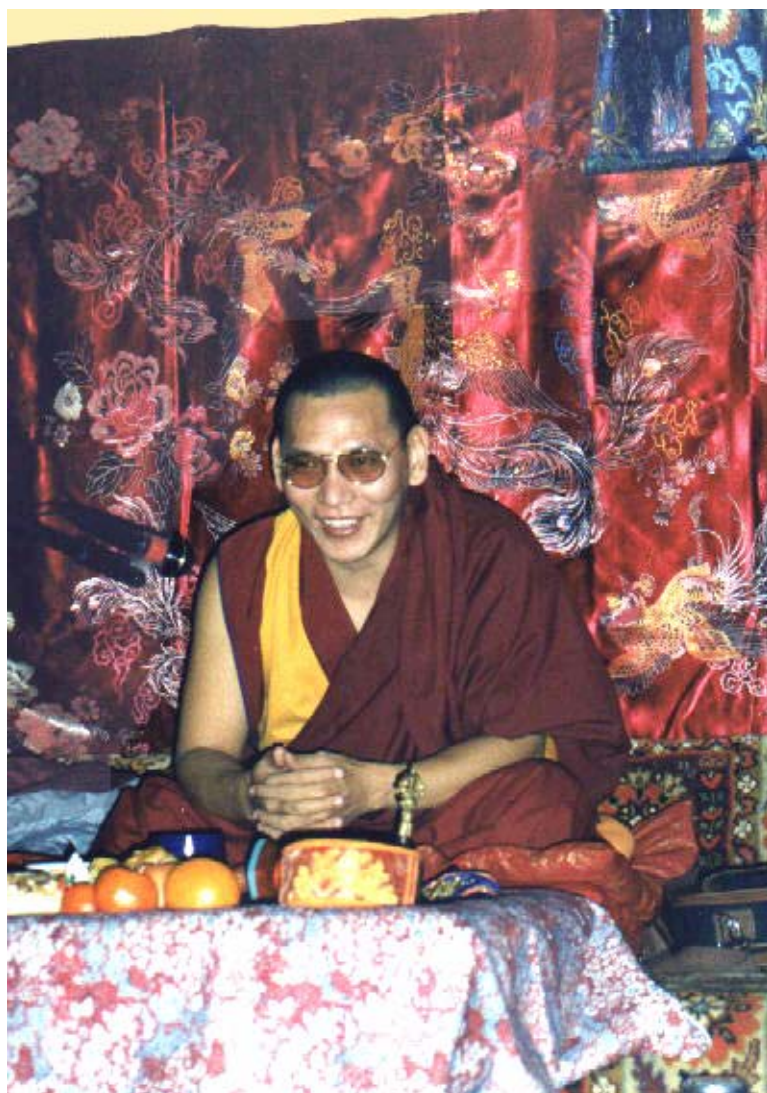
Досточтимый Геше Джампа Тинлей